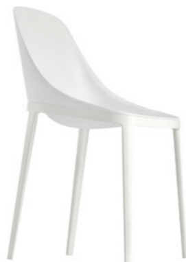
Elle , Eugeni Quitllet, Honorable Mention at the Compasso d'Oro, 2014