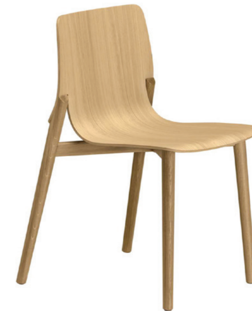
Kayak , Patrick Norguet, Honorable Mention at the Compasso d'Oro, 2016